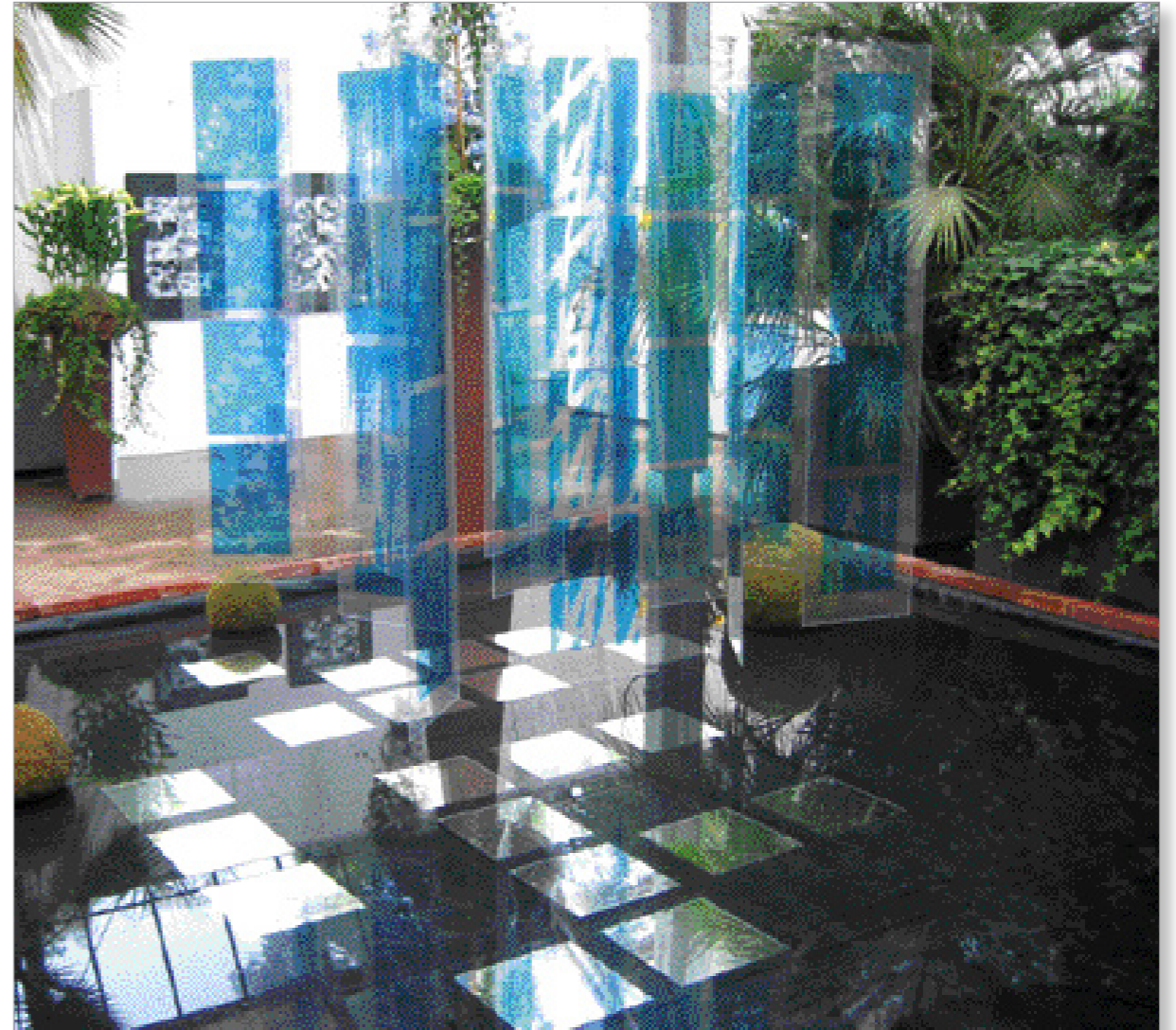
„Blaue Gespinste“ Installation, Fotodruck auf Plexiglas 20-teilig, je 30 x 130 cm 2003